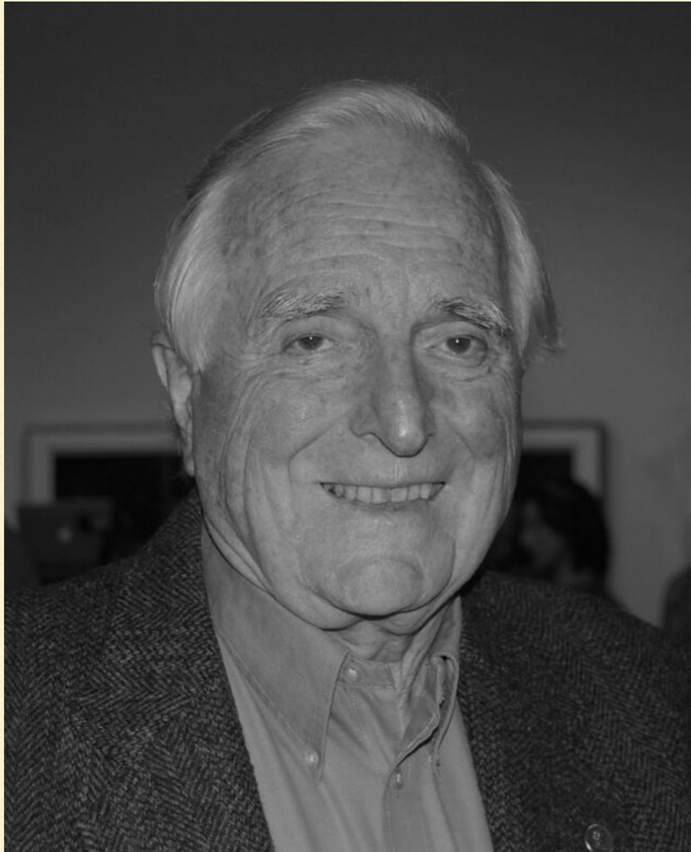
Douglas Engelbart - twórca idei myszy komputerowej